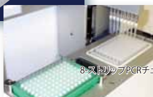
8-ストリップPCRチューブ