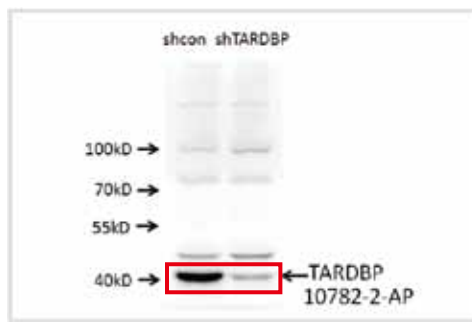
shRNA またはコントロールで処理した A549 細胞の TDP43(TARDBP) 発現。 使用抗体 品番：10782-2-AP Data provided by Angran Biotech (www.miRNAlab.com)