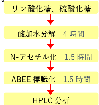
図1 ABEE 標識化の流れ