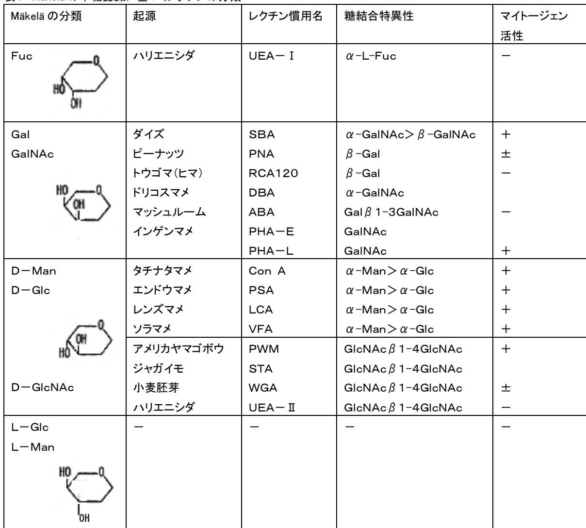
表1 Mäkelä の単糖認識に基づくレクチンの分類

1957年 O. Mäkelä が、糖のC-3、C-4位の水酸基の配位により、4郡に分類しました(表1)。第4郡に分類されるレクチンはまだ発見されておりません。最近では、レクチンの1次構造が解析され、その構造に基づく分類(ファミリーによる分類)もされています(表2)。