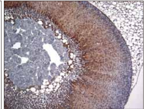
図 2 : 染色例