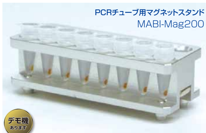
PCRチューブ用マグネットスタンド MABI-Mag200