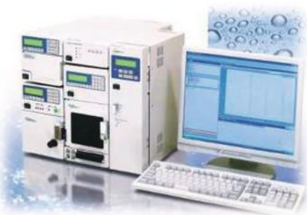
液体クロマトグラフィー (HPLC)