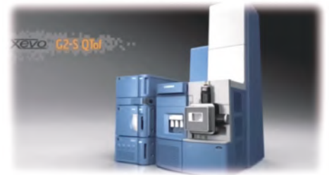
超高速液体クロマトグラフ質量分析装置 Waters社製Xevo G2-S QToF