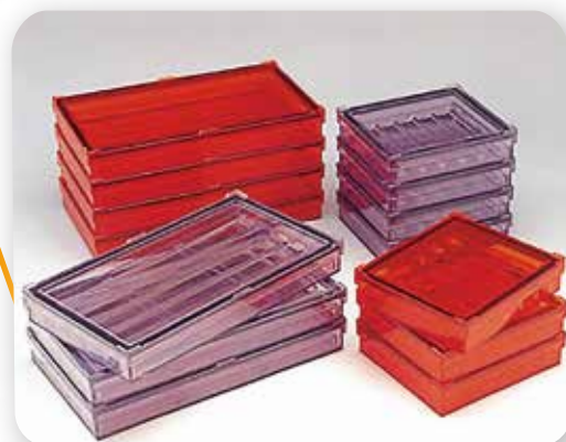
大 (20 枚用) 345×195×48 mm